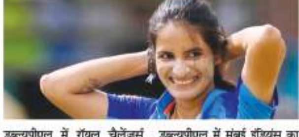
डब्ल्यूपीएल में रॉयल चैलेंजर्स बेंगलुरु से जुड़ी थीं। वह सीपीएल में खेलने वाली पहली भारतीय महिला थीं और उन्होंने टूर्नामेंट में सर्वाधिक विकेट लिए। फिलहाल वह इंग्लैंड ए के खिलाफ इंडिया ए