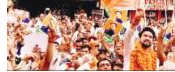
गरीबों का हित सर्वोपरि है। टाकुर ने रविवार को पार्टी मुख्यालय में

टीएम एक्शन इंडिया/नई दिल्ली केन्द्रीय मंत्री अनुराग टाकुर ने कहा कि देश की जनता को प्रधानमंत्री मोदी पर भरोसा है। चुनावी राज्यों ने दिखा दिया है कि गारंटी केवल प्रधानमंत्री मोदी की चलती है और जनता को डबल इंजन की सरकार पसंद है। प्रधानमंत्री मोदी के लिए युवाओं, महिलाओं, किसानों और