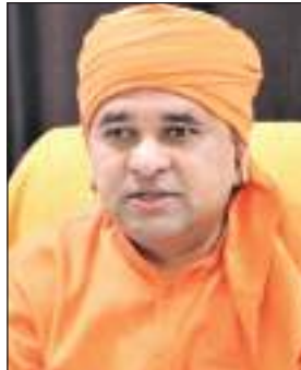
शिवसत दी है। चुनाव जीतने के बाद उन्होंने समाचार एजेंसी एनआई से बातचीत की। उन्होंने जीत पर खुशी जाहिर करते हुए कहा, "यह सीट हमारी पार्टी के