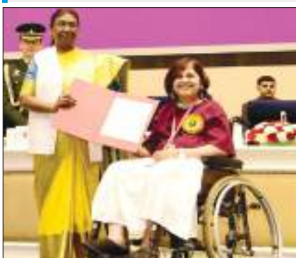
दिव्यांग दिवस पर वर्ष 2023 के लिए दिव्यांगों के सशक्तिकरण के लिए राष्ट्रीय पुरस्कार प्रदान करते हुए राष्ट्रपति