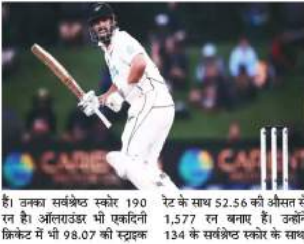
डेट के साथ 52.56 की औसत से 1,577 रन बनाए हैं। उन्होंने 134 के सर्वश्रेष्ठ स्कोर के साथ, उनका सर्वश्रेष्ठ स्कोर 190 रन है। ऑलराउंडर भी एकदिनी क्रिकेट में भी 98.07 की स्ट्राइक

सिलहट। न्यूजीलैंड के ऑलराउंडर डेरिल मिशेल ने शनिवार को अंतरराष्ट्रीय क्रिकेट में 4,000 रन पूरे कर लिए हैं। मिशेल ने सिलहट में बांग्लादेश के खिलाफ पहले टेस्ट मैच के दौरान यह उपलब्धि हासिल की। मैच में, मिशेल ने पहले के साथ अच्छा प्रदर्शन करते हुए, पहली पारी में 41 और दूसरी पारी में 58 रन बनाए। मिशेल ने 114 अंतरराष्ट्रीय मैचों में, 41.43 के औसत से 4,061 रन बनाए हैं। उनका सबसे अच्छा स्कोर 190 है।